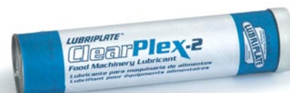
Auch in Kübeln, 1/4-Fässern, Fässern u. Perma-Schmiersystemen erhältlich.

Diese gedickten Aluminiumkomplex-Schmierfette sind gemäß NSF H-1 registriert und wurden zur Verwendung in Gleit- und Wälzlagern in der Lebensmittelverarbeitungs- und Getränkeverarbeitungsindustrie konzipiert. CLEARPLEX-1 ist ideal für Schmiersysteme von Hochgeschwindigkeitsdosenweiß- und -verschleißmaschinen. Enthält zinkoxidfreies Antiverschleiß-Additiv.