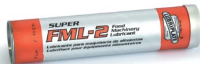
Diese Serie ist auch in Dosen, Kübeln, 1/4-Fässern, Fässern u. Perma-Schmiersystemen erhältlich.

Diese weißen Mehrzweckschmierfette sind bereits seit Jahren führend in der Lebensmittelverarbeitungsindustrie.