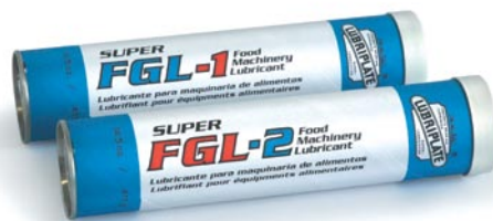
Diese Serie ist auch in Dosen, Kübeln, 1/4-Fässern, Fässern u. Perma-Schmiersystemen erhältlich.

Wurde für die Anforderungen von Werksingenieuren der Lebensmittel- und Getränkeindustrie entwickelt, die Schmierfette der Klasse H-2 ganz durch Schmierfette der Klasse H-1 ersetzen möchten. Angereichert mit Verschleißschutz-, Rostschutz- und Korrosionsschutz-Additiven, die kombiniert eine ausgezeichnete Scherstabilität, Belastbarkeit und Beständigkeit bei Abspritzanwendungen mit Wasser und Beizmitteln bieten. In vier NLGI-Dichten für eine Vielzahl von Anwendungen erhältlich. FGL-CC ist für zentralisierte/automatische Schmiersysteme auf Hochgeschwindigkeitsdosenverschleißmaschinen.