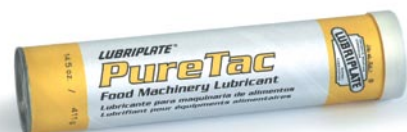
Auch in Kübeln, 1/4-Fässern, Fässern u. Perma-Schmiersystemen erhältlich.

Diese klebrigen, äußerst wasserfesten Haftschmierfette sind gemäß NSF H-1 registriert und wurden für Anwendungen entwickelt, in denen chemisch behandeltes Wasser, Wärme und Dampf vorkommen. Für alle Arten von Lagern mittlerer und langsamer Geschwindigkeit, offene Getriebe und Ketten hydrostatischer Kocher.