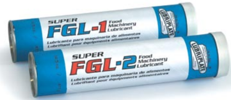
Cette série est également disponible en boîtes, seaux, quarts de baril, barils et système de lubrification Perma.

Conçues pour répondre aux exigences des ingénieurs des usines du domaine alimentaire et boissons qui veulent des graisses de classe H-1 pour remplacer entièrement les graisses de classe H-2. Fortifiées avec des additifs contre l'usure, la rouille et la corrosion qui s'allient pour offrir une excellente stabilité protectrice, une capacité de transport de charge et une résistance à l'eau et au lavage caustique. Disponible en quatre densités NLGI pour une multitude d'applications. La FGL-CC convient pour les systèmes à lubrification centralisées et automatiques sur des équipements de scellage de conserve à grande vitesse.