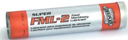
Cette série est également disponible en boîtes, seaux, quarts de baril, barils et système de lubrification Perma.

Ces graisses blanches, à base de calcium anhydre, polyvalentes, sont toujours disponibles. Elles sont fort appréciées par l'industrie de traitement des aliments depuis des années. Disponibles en trois densités NLGI pour une multitude d'applications.