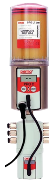
PRO C MP-6