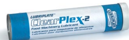
Également disponible en seaux, quarts de baril, barils et système de lubrification Perma.

Ces graisses épaissies au complexe aluminium, enregistrées NSF H-1 sont conçues pour les paliers et les roulements antifriction utilisés dans l'industrie des aliments et des boissons. CLEARPLEX-1 est parfaitement appropriée aux systèmes de lubrification des équipements de mise en boîte rapide. Contient un additif anti-usure exempt d'oxyde de zinc.