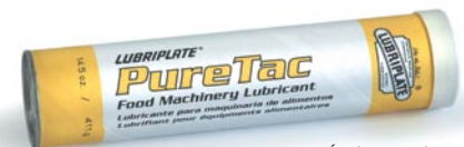
Également disponible en seaux, quarts de baril, barils et système de lubrification Perma.

Ces graisses visqueuses, adhésives, très résistantes à l'eau, enregistrées NSF H-1 sont conçues pour les applications sujettes à l'eau traitée chimiquement, à la chaleur et à la vapeur. Pour tous les types d'équipement, permet de ralentir les roulements, de libérer ouvrir les et les chaînes de cuiseur hydrostatique.